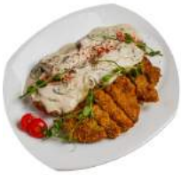
Свинная отбивная с грибами