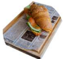
Круассан с лососем и сливочным сыром