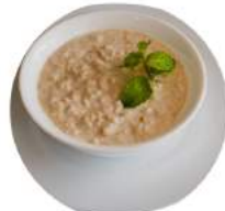
Каша рисовая на молоке