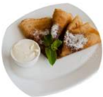
Блинчики со сметаной