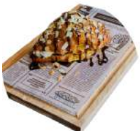
Круассан с Нутеллой