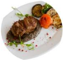
Филе Миньон с грибным соусом и овощами