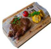
Стейк из свиной шеи на гриле