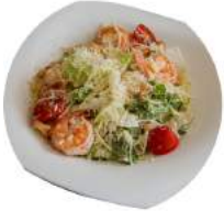
Салат Цезарь с Кrevetками