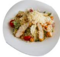
Салат Цезарь с курицей